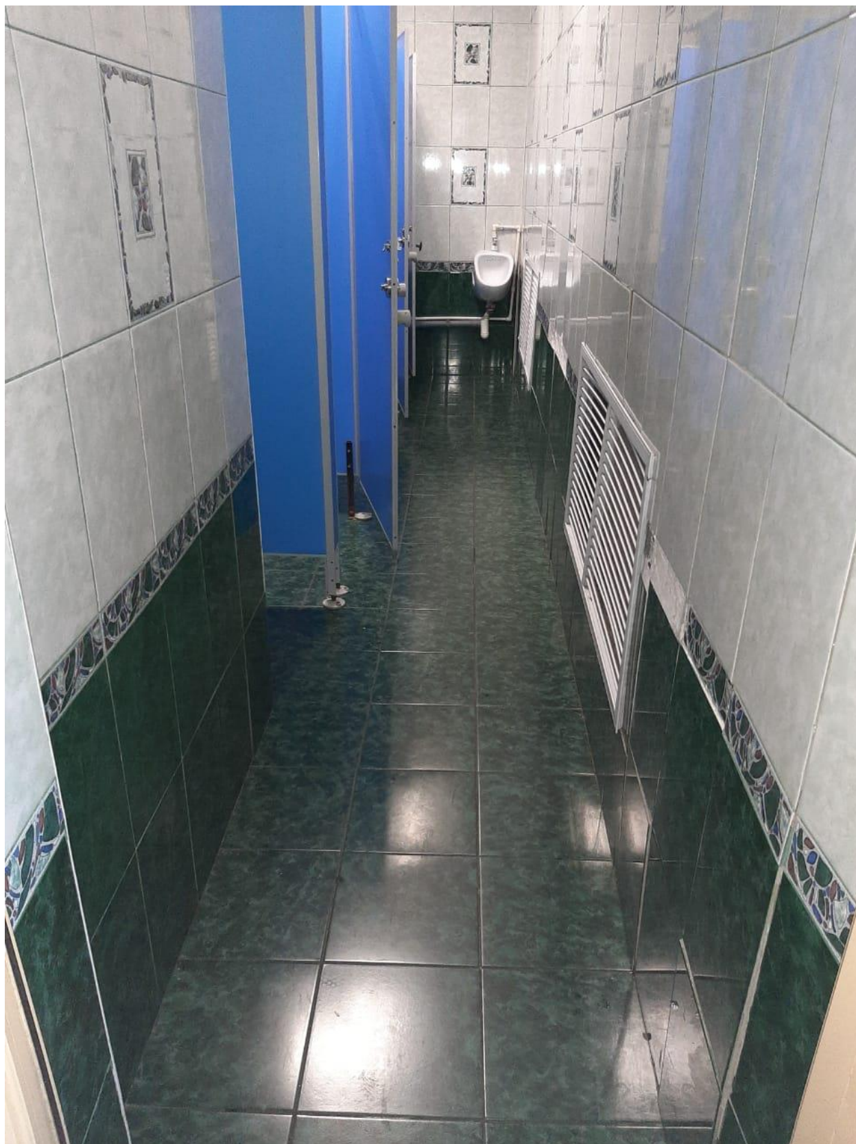
Фото 10. Туалетная комната