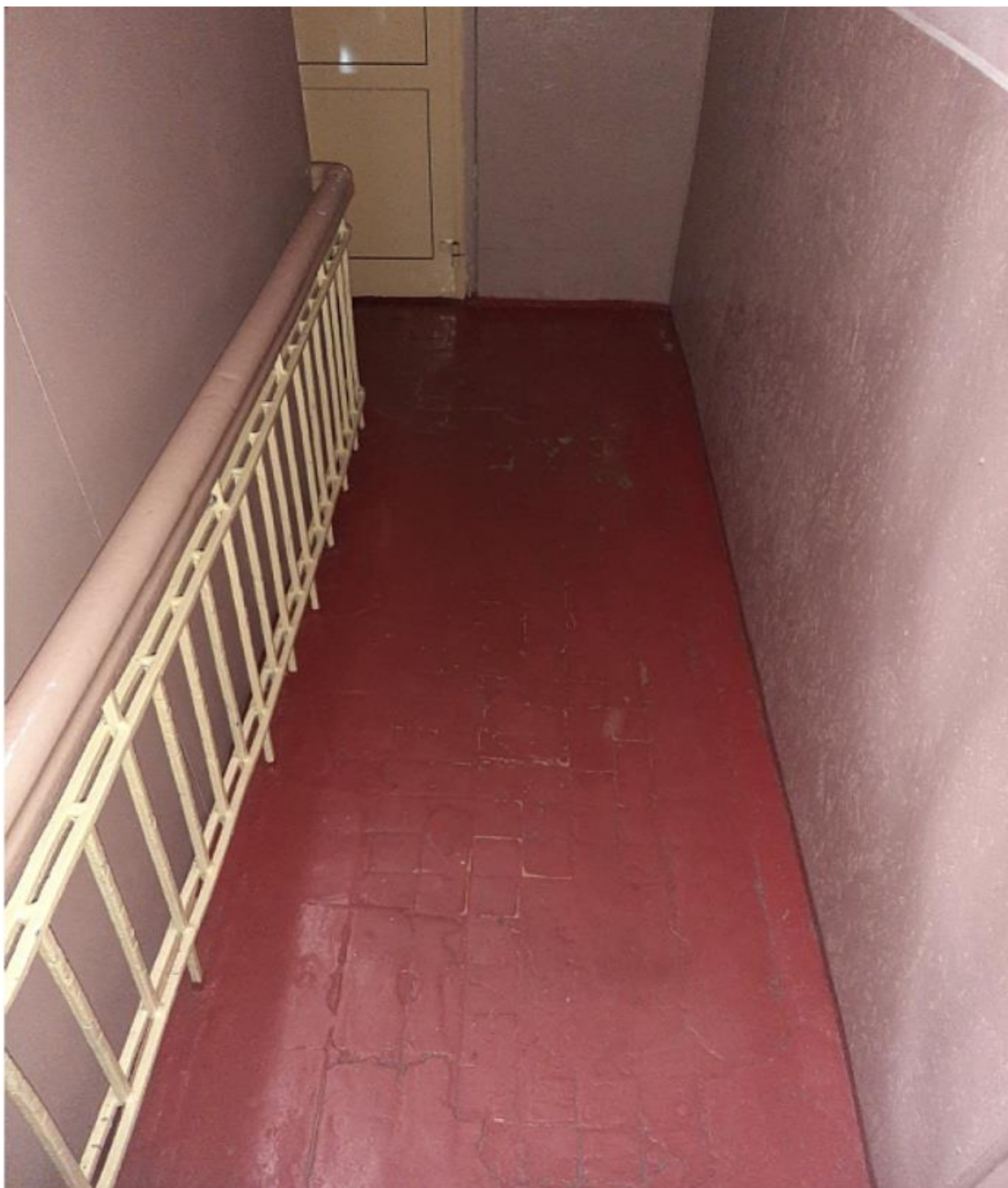
Фото № 8. Пути эвакуации