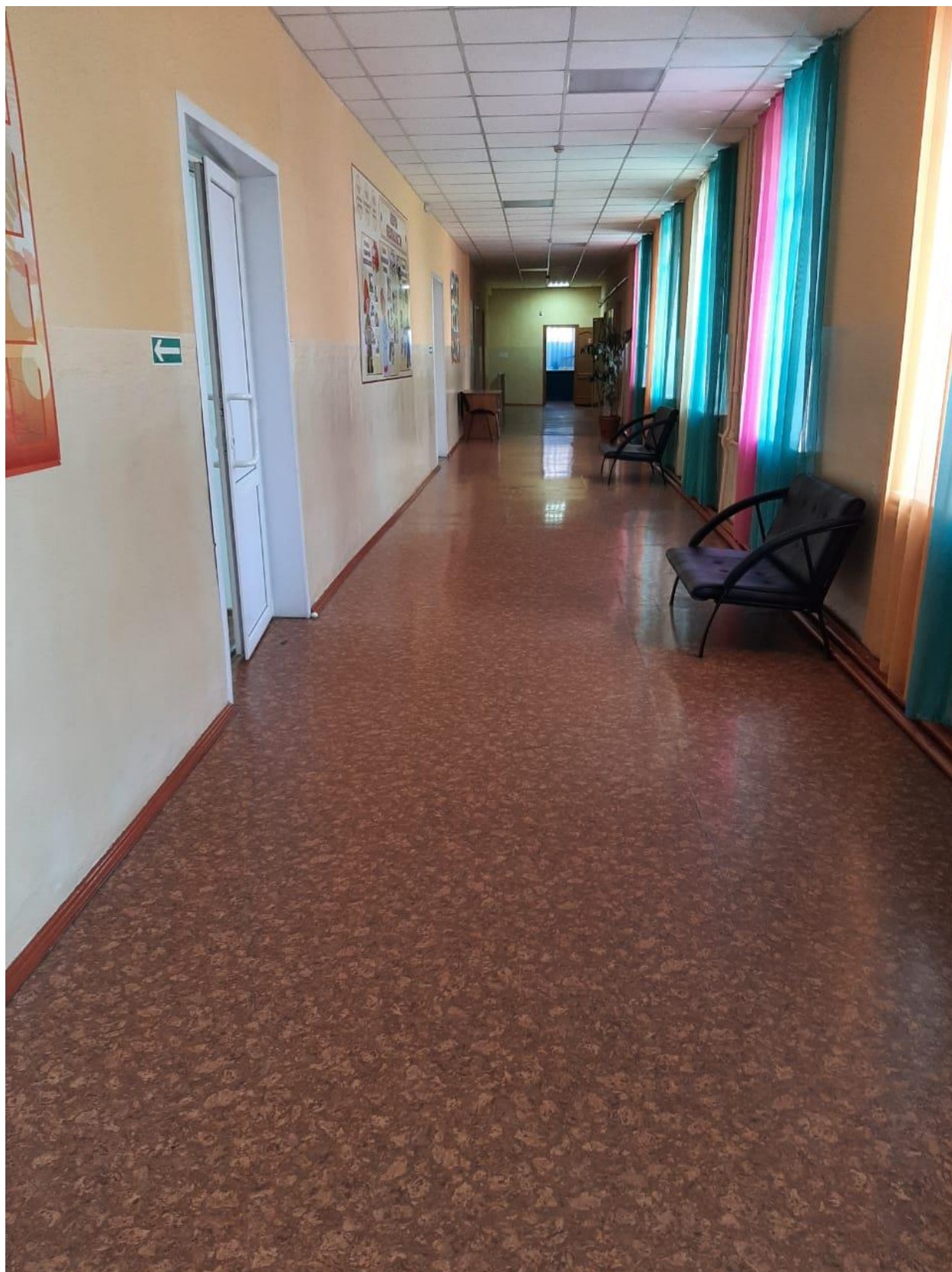
Фото № 6. Коридор и вестибюль