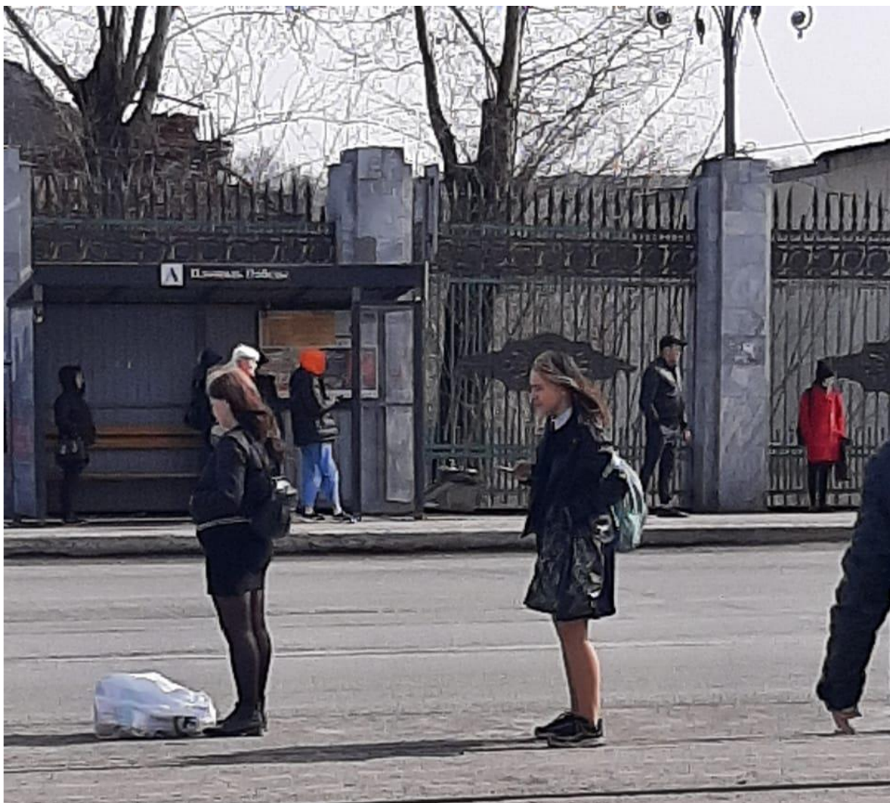
Фото № 11 - 14. Пути движения к объекту (от остановки транспорта)