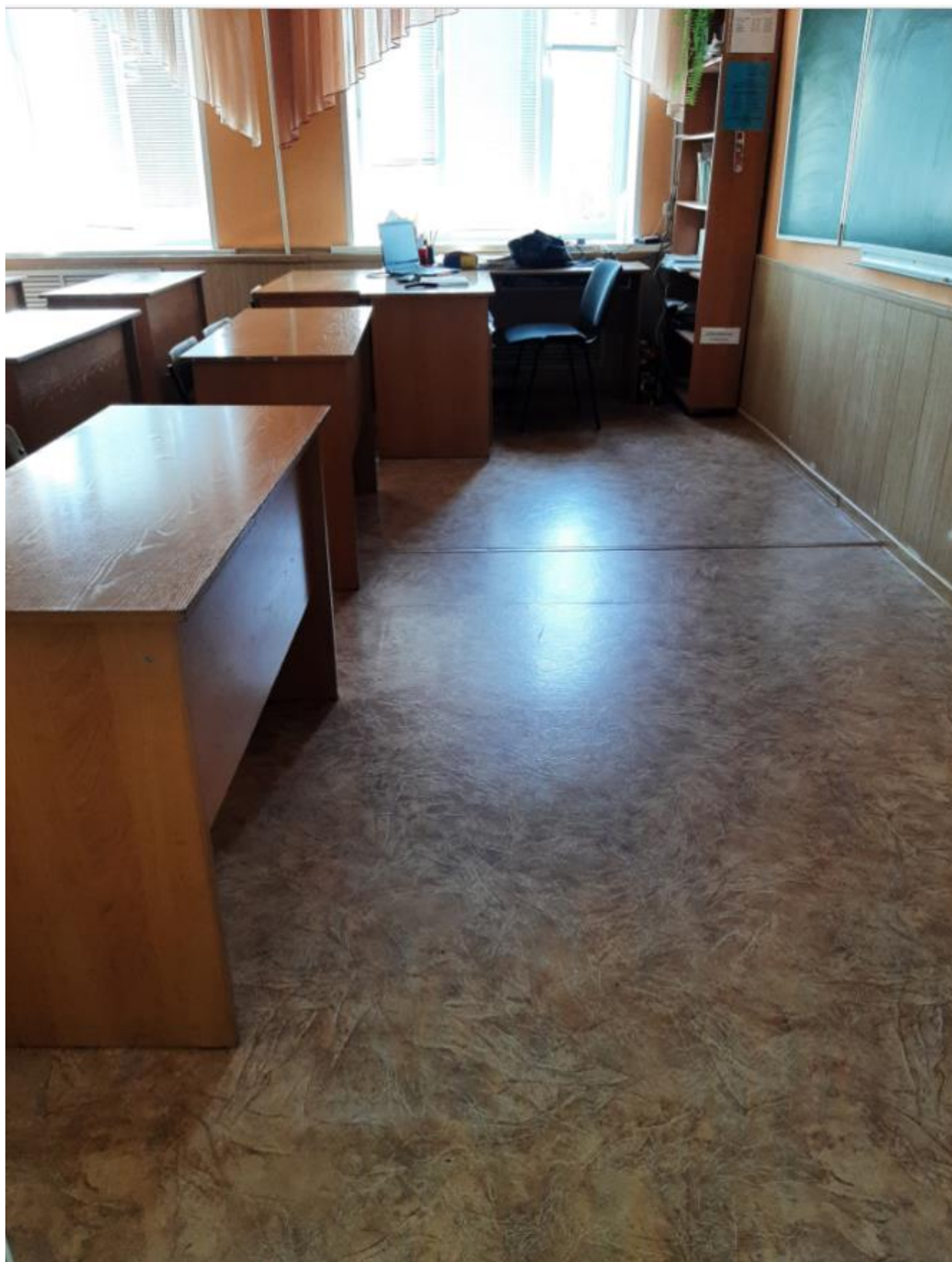
Фото № 9. Учебный кабинет