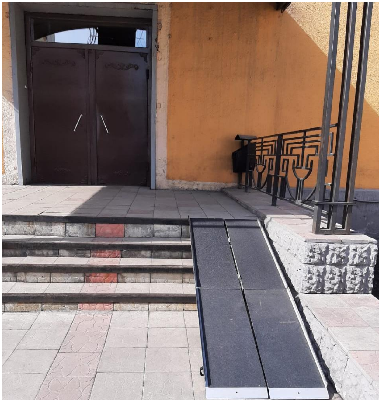
Фото № 4. Дверь (входная). Входная площадка (перед дверью)